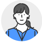
[2021 지방직 일반농업 합격] 총 수험 기간 1년 6개월

“아기 엄마, 누구 엄마라고만 불리다가 다시 제 이름이 불리고, 사회의 구성원이 되니 너무 만족스럽습니다. 출근하는 자체가 너무 행복합니다.”